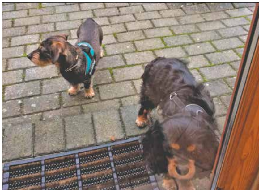
Åge og nevø, Cico, som hurtigt måtte lære, at mad i Åges hjem ikke er noget, man nipper til indimellem.