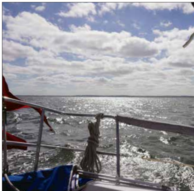
Gjøl Bredning (herover). Frederik den VII kanal til venstre, og Løgstør Bredning til højre.