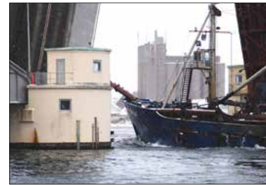
Havneslam fra Toreby Sejlklub sejles til Kogrund i "Kronos".

Hans: Læhegnet mod kajakklubben bliver ordnet.