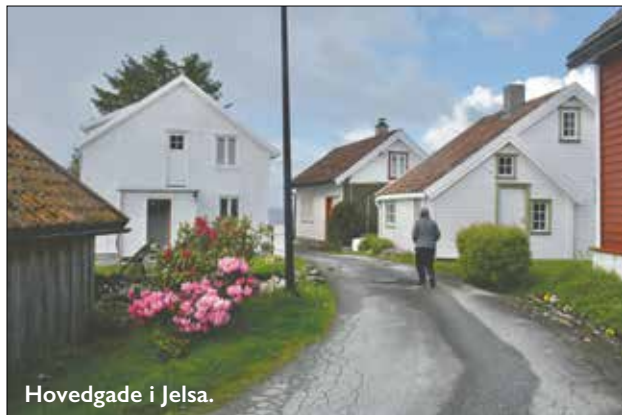
Hovedgade i Jelsa.