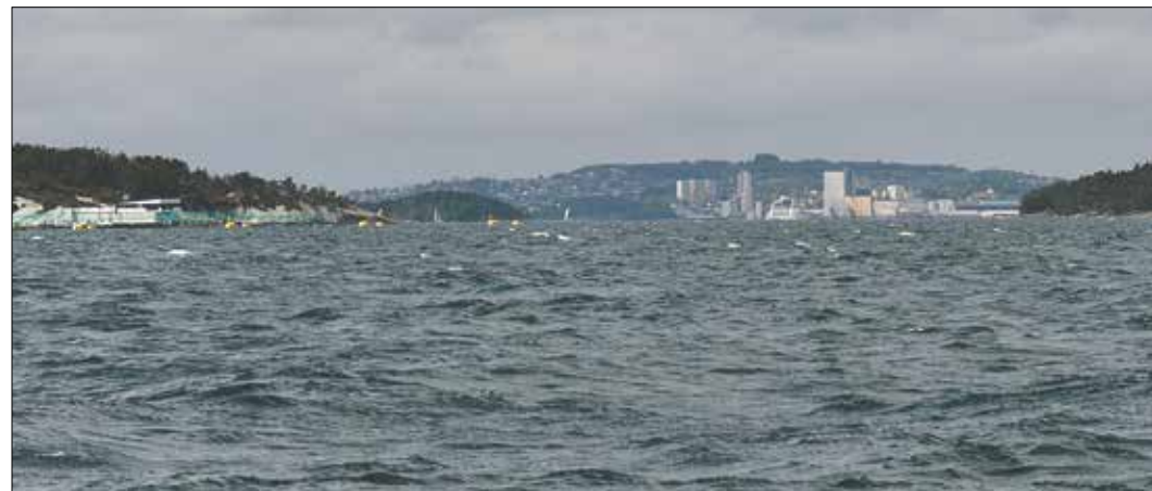
Udsigt mod Stavanger.

fortøje. I stedet finder vi en god plads, som på fredage og lørdage er reserveret fiskebåde, som sælger ud af deres fangster. Eftersom vi endnu har et par rejer ombord, og da lørdagen snart er ovre, kaster vi rebene i land og binder "Marquesas" forsvarlig fast.