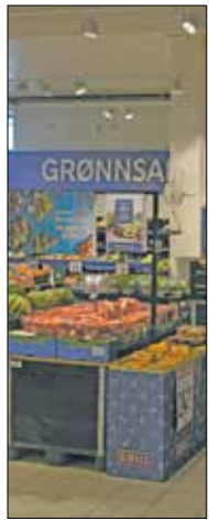
Indkøb i Jørpeland.