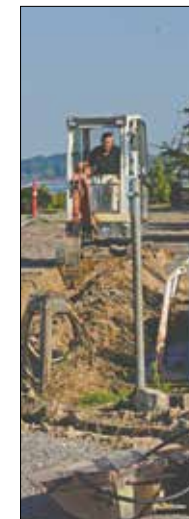
20. juni blev planen lagt for at føre elektricitet frem til bagerste vinterplads. Arkivfoto.