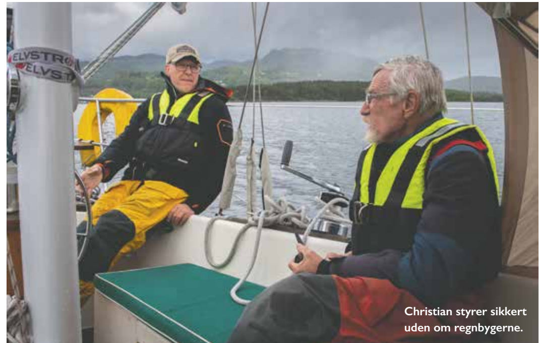
Christian styrer sikkert uden om regnbygerne.