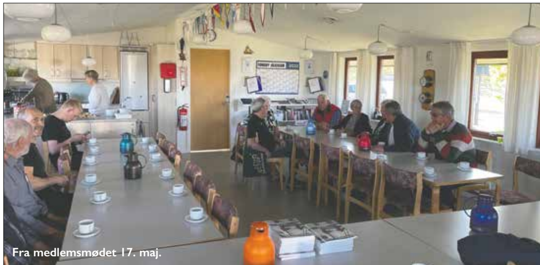
Fra medlemsmødet 17. maj.