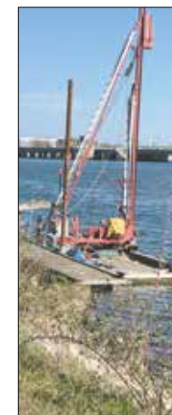
Ramslaget før motorstoppet.